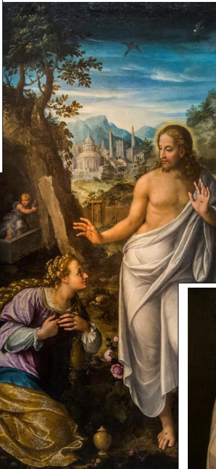
Fede Galizia (1616) Noli me tangere, Pinacoteca di Brera, Milano, Italia.