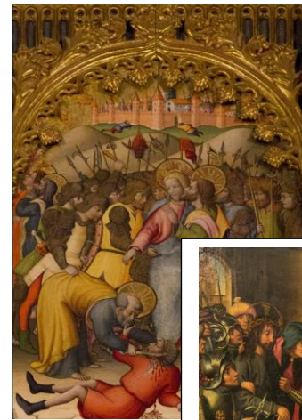
Dello Delli (1440 –l.) osa Salamancan katedraalin alttaritaulusta