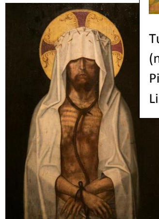
Tuntematon mestari 1570. Ecce homo. Lissabonin taidemuseo