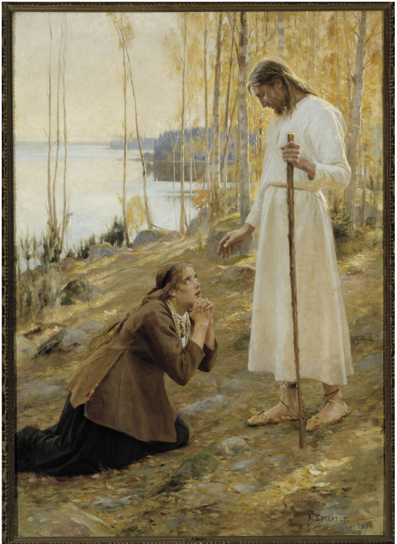
Albert Edelfelt: Kristus ja Matalaena, 1890, öljy kankaalle, 216,0 x 152,0 cm, Kansallisgalleria / Ateneumin taidemuseo.