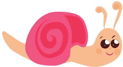
Tutkin ja toimin ympäristössäni