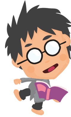
Kielten rikas maailma