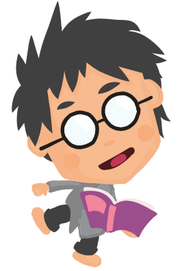
Kielten rikas maailma