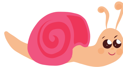
Tutkin ja toimin ympäristössäni