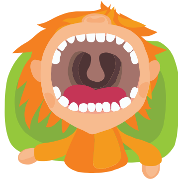
Ilmaisuuden monet muodot